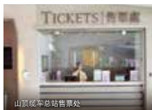
山顶缆车总站售票处